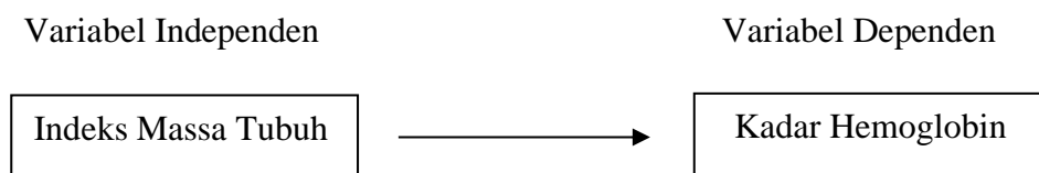
Gambar 2 Kerangka Konsep

Kerangka konsep dalam penelitian pada dasarnya adalah kerangka hubungan antara konsep-konsep yang ingin diamati atau diukur melalui penelitian yang akan dilakukan (Notoatmodjo, 2014). Kerangka konsep yang digambarkan sebagai berikut: