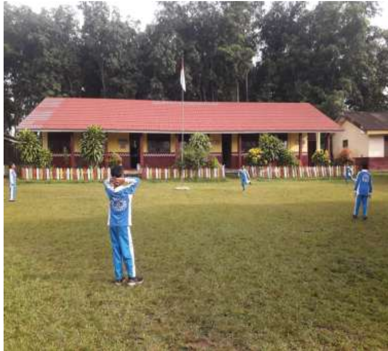
(Kondisi siswa saat jam olahraga di SD N 34 Negeri Katon)