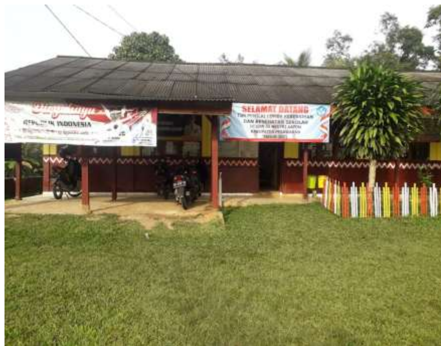
(Di depan kantor SD N 34 Negeri Katon)