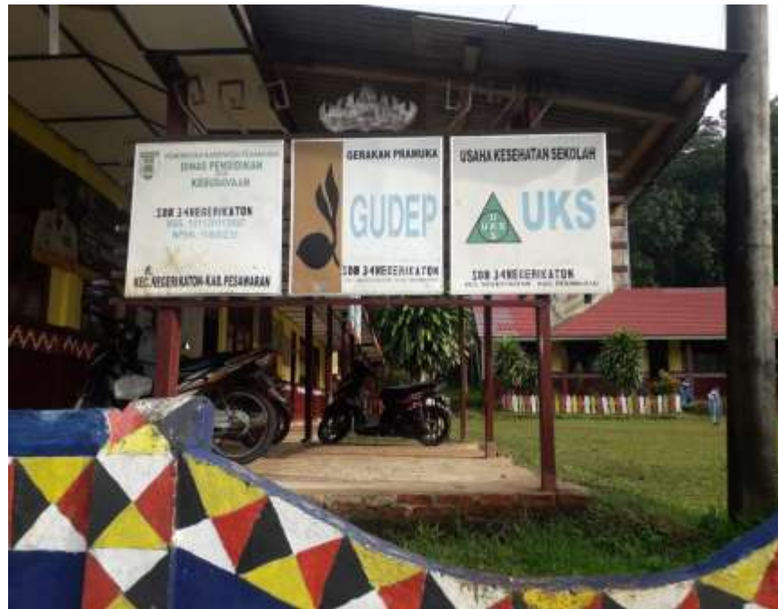
(Profil SD N 34 Negeri Katon)