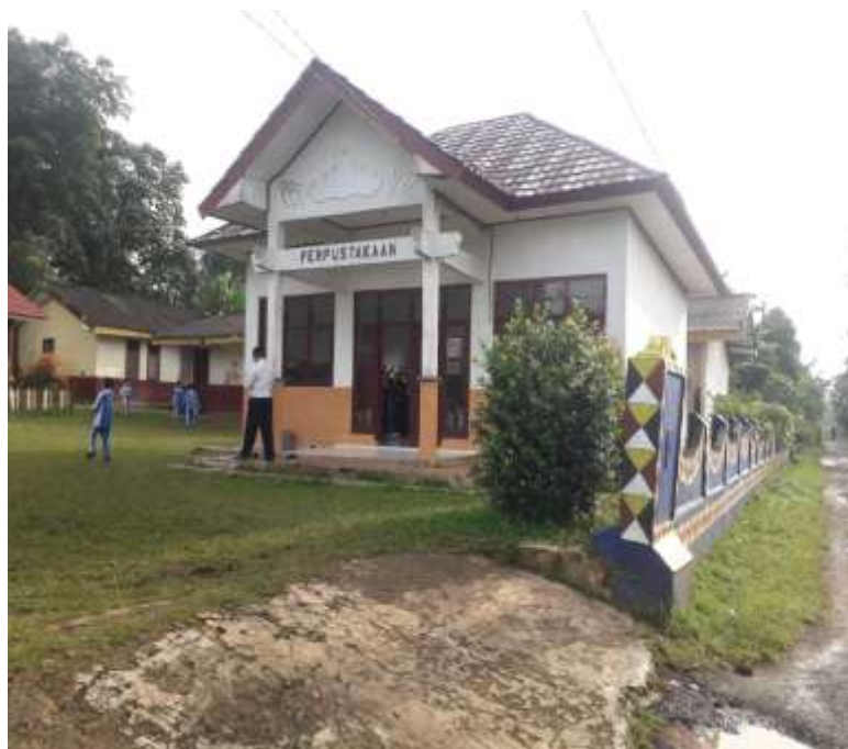
(Perpustakaan SD N 34 Negeri Katon)